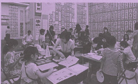
●ワークショップで書道体験