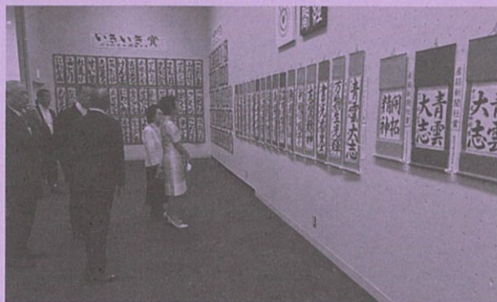
●高円宮妃久子殿下がご見学