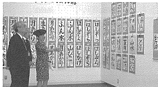
●高円宮妃殿下がご内覧